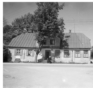
Talsu apriņķa izpildu komitejas priekšsēdētāja Otto Feldberga dzīves vieta.