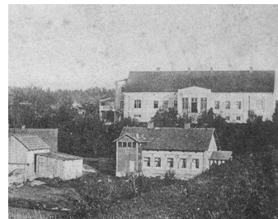
Nams, kur 1919. gadā atradās padomju pulka 1. rotas štābs un kazarmas.