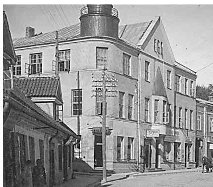
Vācu okupācijas varas pārstāvja barona Anatola fon den Brinkena rezidence.