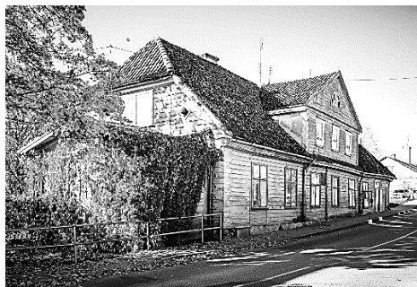
Nams, kurā 1919. gada bija izvietots kara tribunāls.