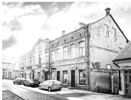
Nams, kurā 1919. gadā atradās Talsu pilsētas valde.